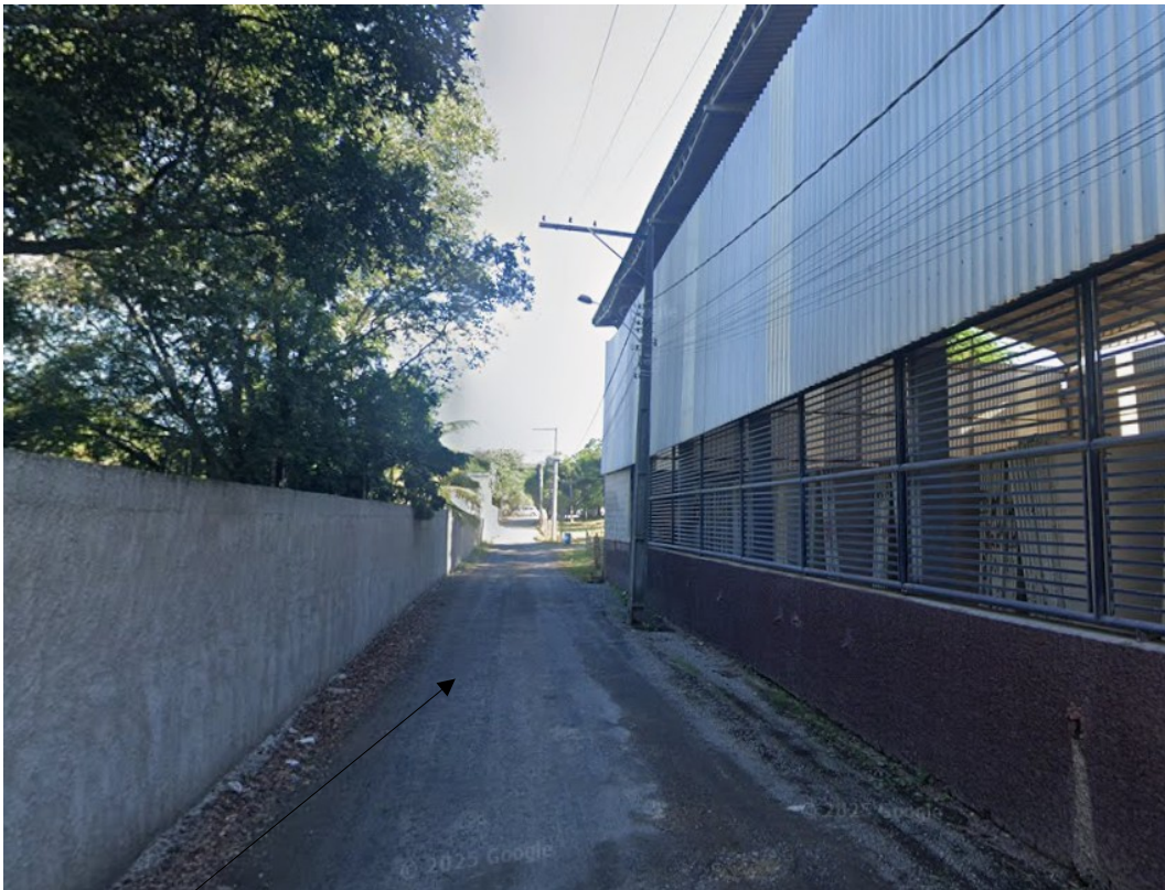
Rua Projetada - Aeroporto